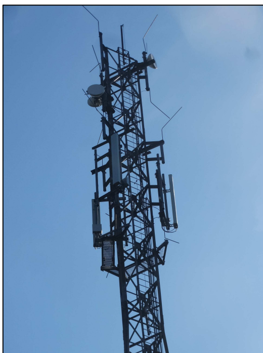
Rys. 3 Widok badanego obiektu