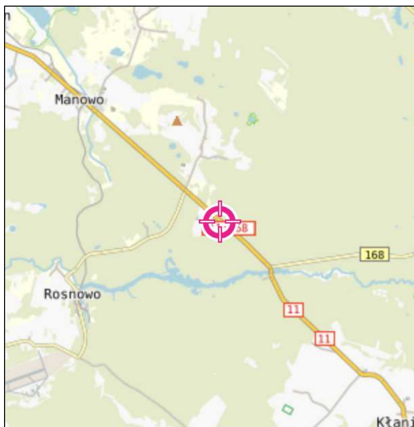
Rys. 1 Lokalizacja badanego obiektu