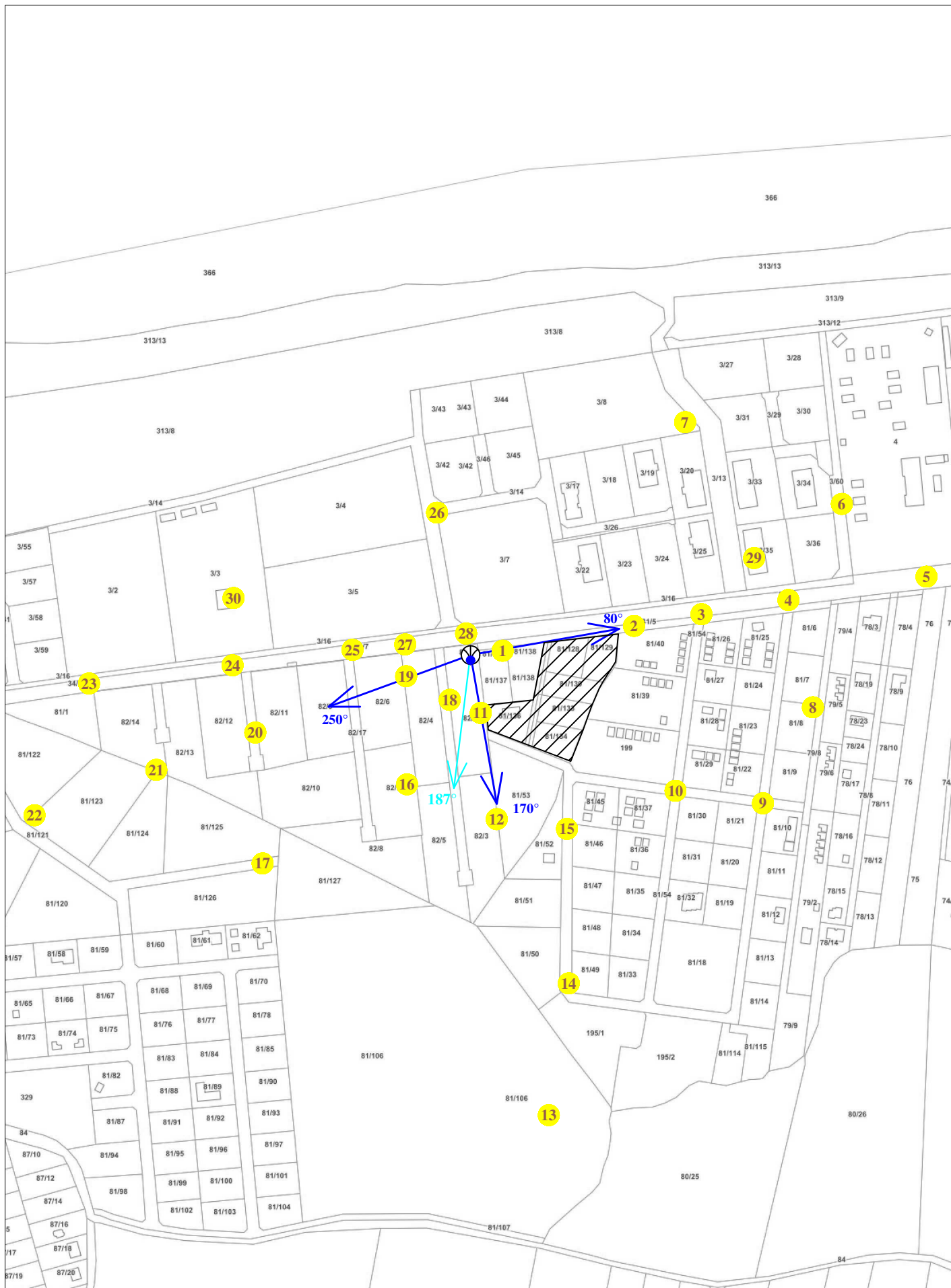
Rys. 2 Lokalizacja pionów pomiarowych

Legenda: brak dostępu antena radiolinowa antena sektorowa źródło PEM pion pomiarowy