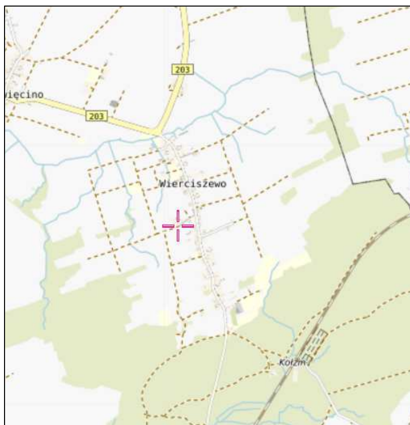
Rys. 1 Lokalizacja badanego obiektu