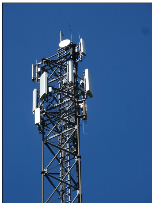
Rys. 3 Widok badanego obiektu