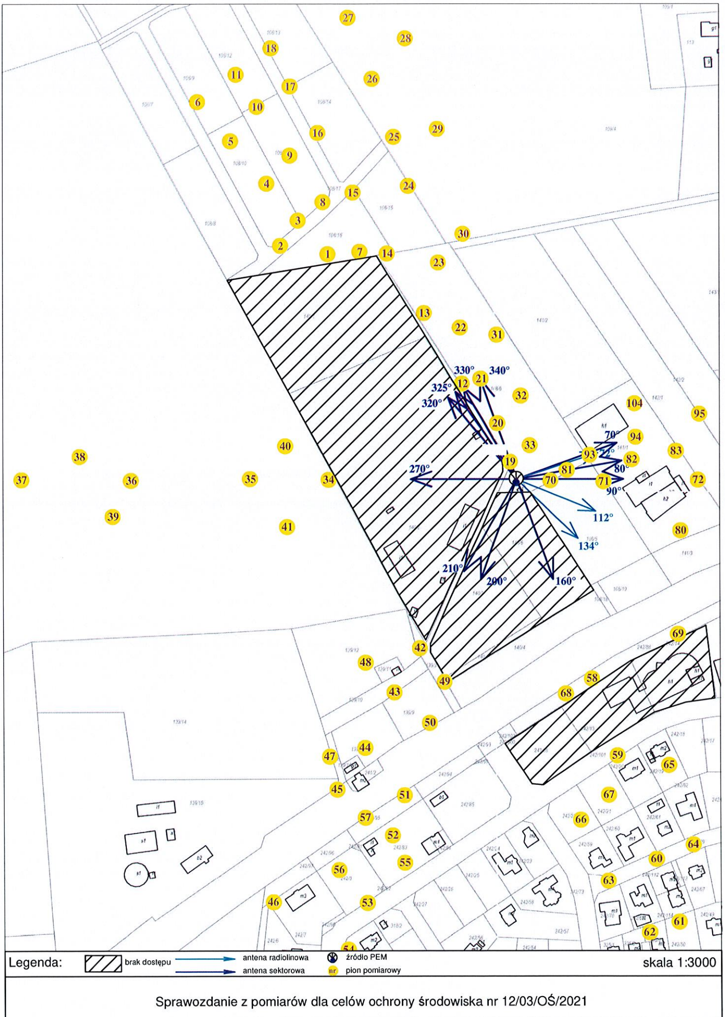
Rys. 2 Lokalizacja pionów pomiarowych