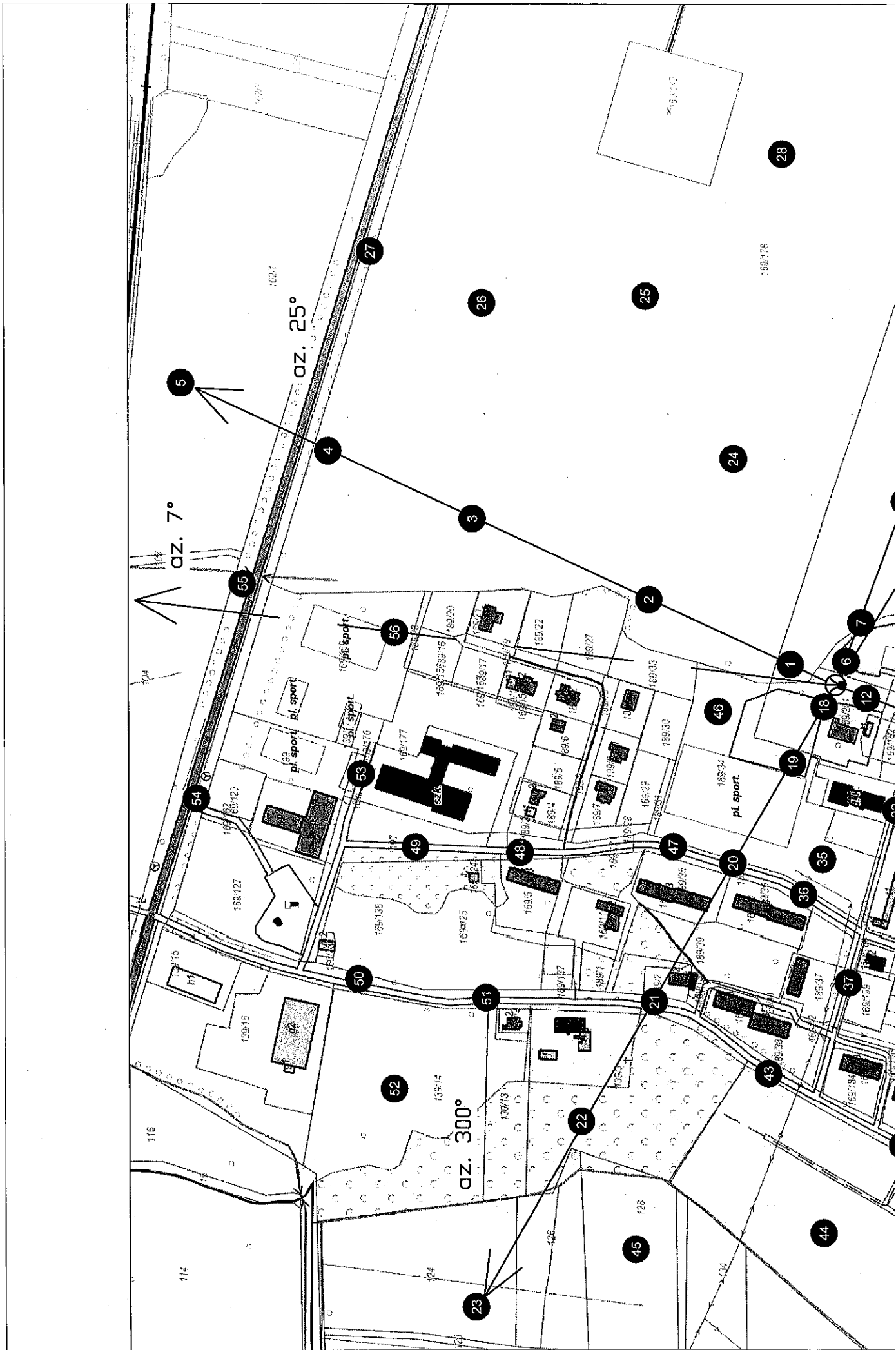
Rys.1 Lokalizacja pionów pomiarowych