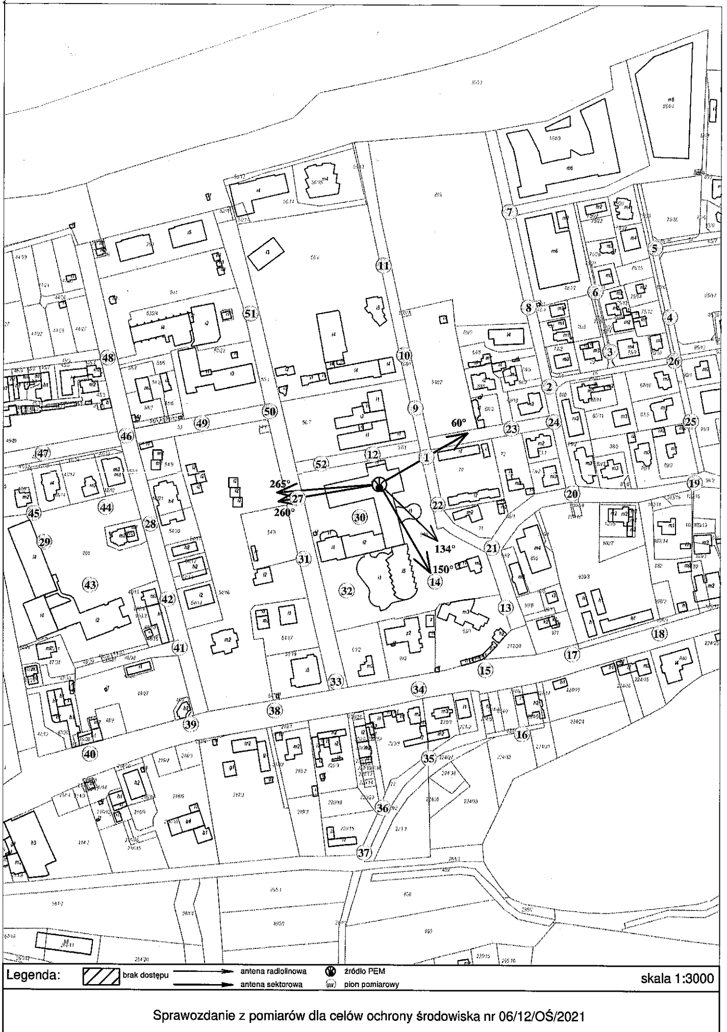
Rys. 2 Lokalizacja pionów pomiarowych