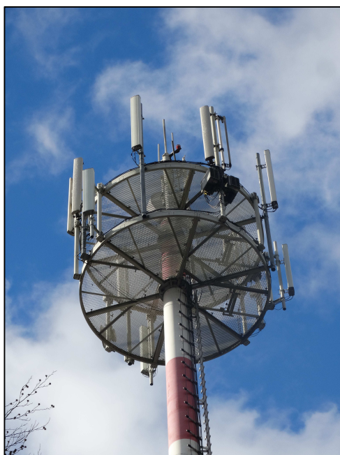
Rys. 3 Widok badanego obiektu