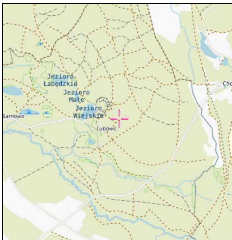
Rys. 1 Lokalizacja badanego obiektu